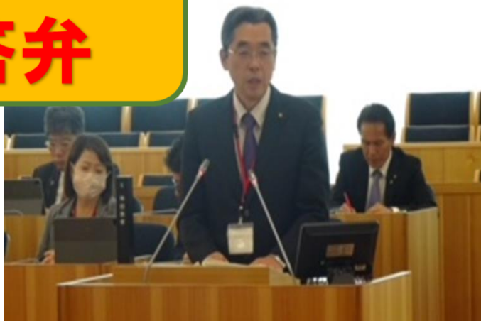
【12月議会一般質問(R5. 12. 13)】