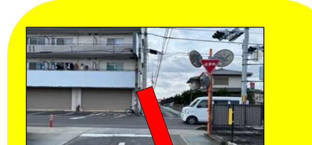
カーブミラーの新規設置 信号機は押しボタン式であり、交通量も多く児童たちにとっても大変危険でした。