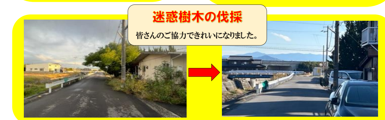
迷惑樹木の伐採 皆様のご協力できれいになりました。