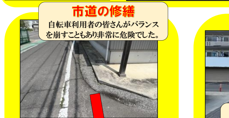
市道の修繕 自転車利用者の皆さんがバランスを崩すこともあり非常に危険でした。